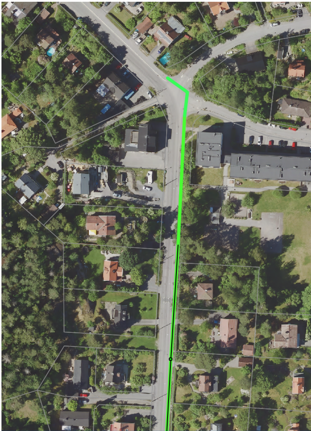
Figur 1. Sträckning av Stambanevägen som inbegrips inom projektet (etapp 1). Del 1 av 2 (norra delen av etapp 1).